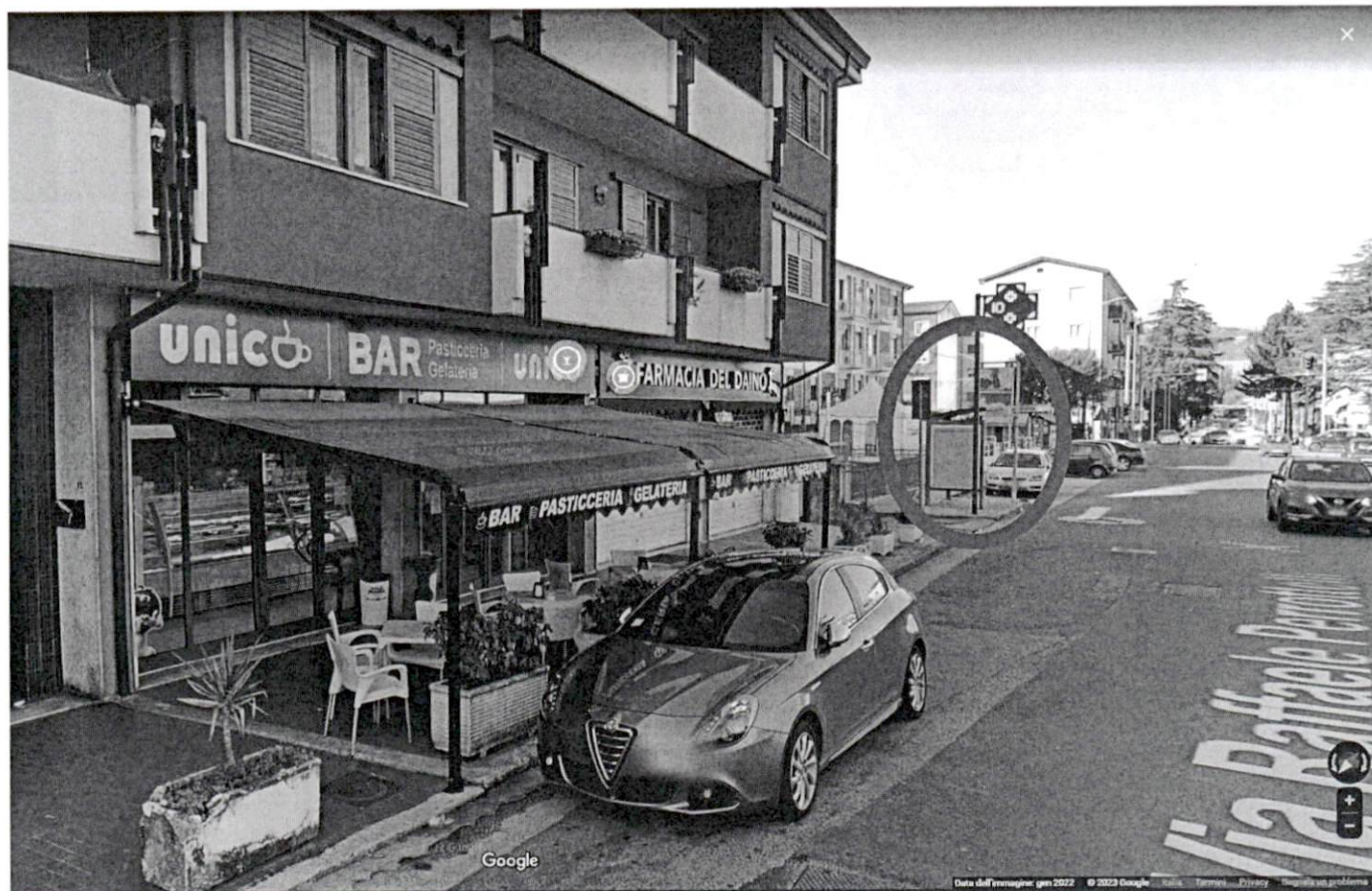
Via Perrottelli, adiacente ex "Bar Dallas"