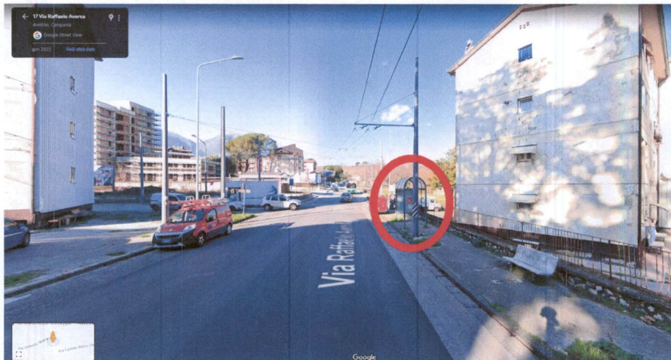
Via Raffaele Aversa, altezza civico 17