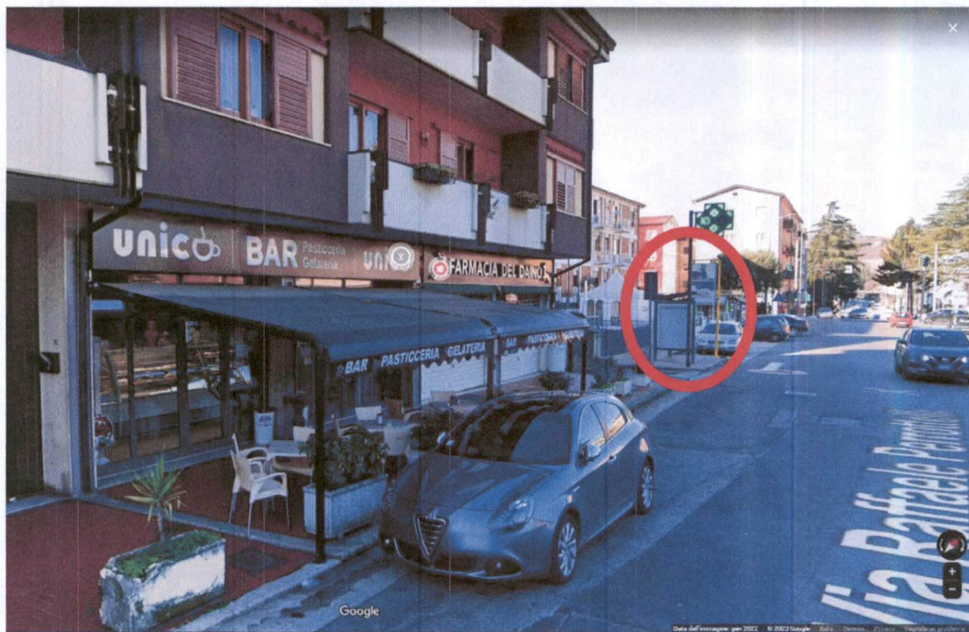
Via Perrottelli, adiacente "Bar Dallas"